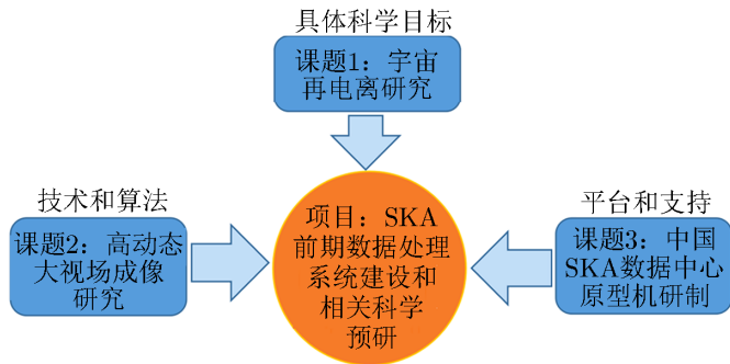
图1 课题与项目的关系