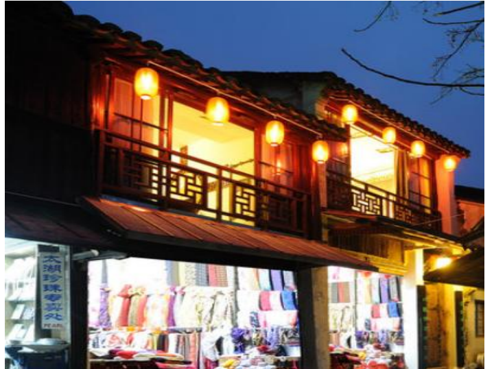
苏州美高美国际酒店简介